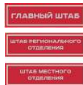
Нарукавный знак, устанавливающий принадлежность к структуре органов ВВПОД «ЮНАРМИЯ»