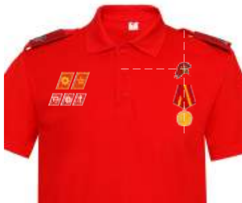
Размещение знаков различия, знаков отличия и иных геральдических знаков на рубашке поло красного (синего) цвета