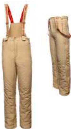
Брюки утеплённые (тактические) бежевого цвета