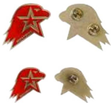
Большая (кокарда) и малая (значок) эмблема ВВПОД «ЮНАРМИЯ»