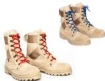
Ботинки с высокими берцами утеплённые бежевого цвета со шнурками красного (синего, бежевого) цвета