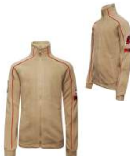
Жакет флисовый бежевого цвета