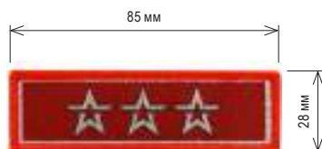
Нарукавный знак, определяющий принадлежность к ВВПОД «ЮНАРМИЯ»