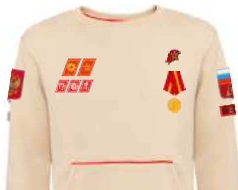
Размещение знаков различия, знаков отличия и иных геральдических знаков на толстовке бежевого цвета