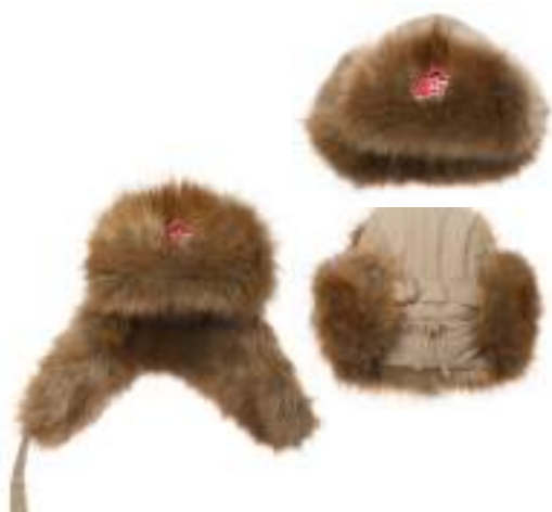
Шапка-ушанка бежевая с искусственным мехом коричневого цвета