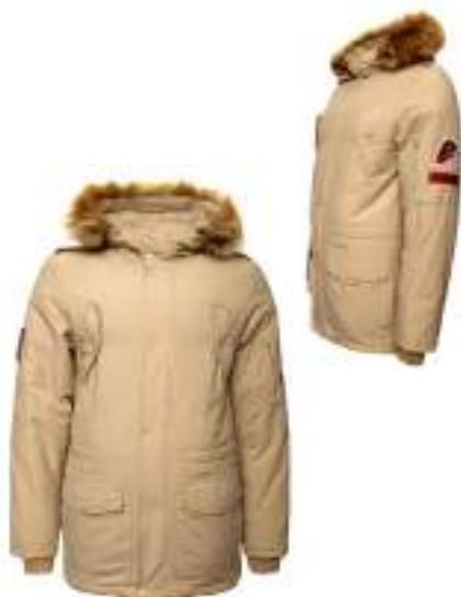
Куртка зимняя утеплённая бежевая с капюшоном и отделкой к капюшону из искусственного меха коричневого цвета