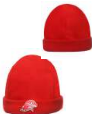
Шапка флисовая вязаная красного цвета